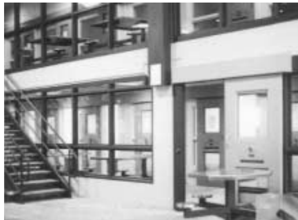
MAKROLON® HYGARD® est parfaitement désigné pour les installations où la sécurité est primordiale.