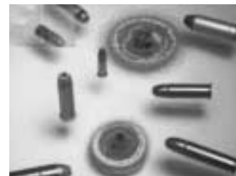
Selon le grade, la résistance aux balles d'armes à feu peut atteindre un Niveau 3.