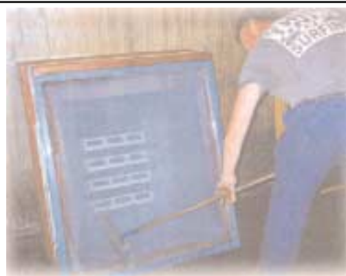
Le produit Clean Strip s'applique avec une brosse.

Le Clean Strip est biodégradable, ininflammable et inodore. Il est disponible en contenant de 30 litres ou 1000 litres.